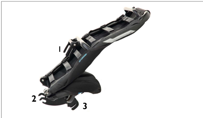
Abb. 3: ErgoMesh Premium Sitz gefaltet 1 - Sitzblech der Rückenlehne, 2 – mittleres Sitzblech, 3 - vorderes Sitzblech

Der Sitz wird mit Schnellspannern an den 3 Sitzbefestigungsaufnahmen am Rad befestigt.