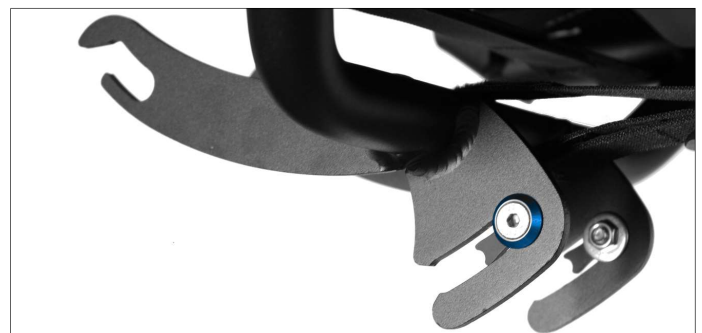
Abb. 2: Sitzanschlätze montiert am ErgoMesh Premium Sitz zur Sicherstellung der Lenkerfreiheit an einer Streetmachine Gte