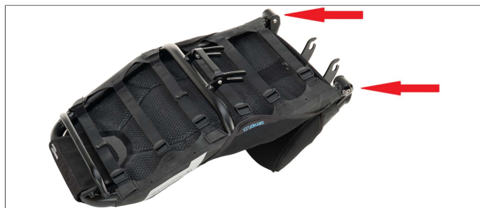
Fig. 1: ErgoMesh seats have a rigid frame. ErgoMesh Premium seats (in the picture) are equipped with Seat-O-Flex -joints

ErgoMesh seats don't have a Seat-O-Flex joint.