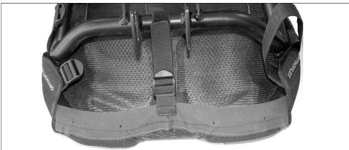
Fig. 4: Seat section from below: The tensioning strap on the short side of the seat cover is placed around the tube piece between the seat connection bracket.

Remove the old seat cover from the seat frame. Pull the new seat cover onto the top of the back part of the frame, close the Velcro fastener. Pull the lower part of the seat cover onto the seat part of the frame.