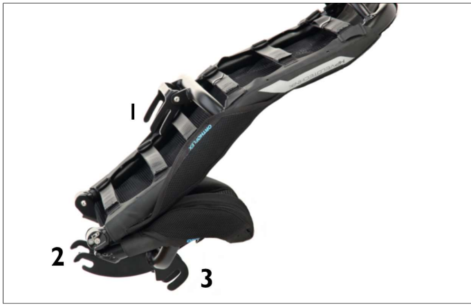
Fig. 3: ErgoMesh Premium seat folded: 1 - seat connection bracket of the backrest, 2 - middle seat connection bracket, 3 - front seat connection bracket

The seat is attached to the recumbent frame with quick releases on the 3 seat mounting tubes.