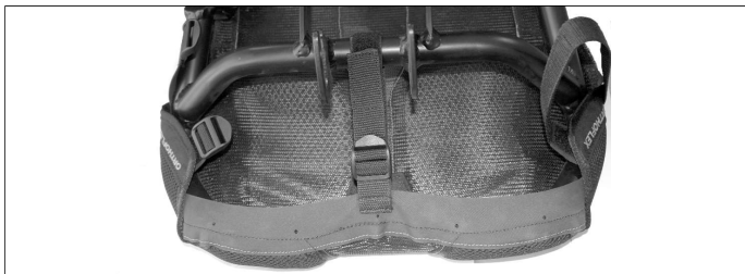
Abb. 4: Sitzteil von unten: Der Spannrücken an der kurzen Seite des Sitzbezugs wird um das Rohrstück zwischen den Sitzblechen gelegt.

Entfernen Sie den alten Sitzbezug vom Sitzgestell. Ziehen Sie den neuen Sitzbezug oben auf das Rückenteil des Gestells, schließen Sie den Klettverschluss. Ziehen Sie den unteren Teil des Sitzbezugs auf das Sitzteil des Gestells.