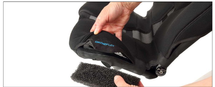
Abb. 5: Einschieben der OrthoFlex®-Polster

Ihrem neuen Sitzbezug liegen vier OrthoFlex®-Polster bei. Diese können je nach Bedarf in die mit "OrthoFlex" gekennzeichneten Taschen am Sitz eingelegt werden. Die langen Polster gehören zur Rückenlehne, die Kurzen zur Sitzfläche. Schieben Sie die OrthoFlex®-Polster in die zugehörigen Taschen. Verschließen Sie die Taschen mit den Klettverschlüssen. Wenn Sie den Sitz abgenommen haben, montieren Sie ihn wieder auf Ihrem Liegerad. Hinweise zur Montage eines ErgoMesh Premium Sitzes finden Sie in dieser Anleitung unter 1. Nehmen Sie auf dem sicher montierten Sitz Platz und überprüfen Sie die Position der OrthoFlex®-Polster. Kleine Korrekturen können Sie im Sitzen vornehmen.