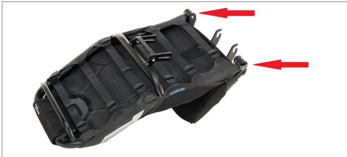
Abb. 1: ErgoMesh Sitze haben einen starren Rahmen. ErgoMesh Premium Sitze (im Bild) sind mit Seat-O-Flex-Gelenken ausgestattet.

ErgoMesh Sitze haben kein Seat-O-Flex-Gelenk.