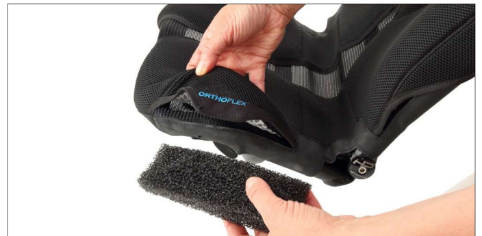
Fig. 5: Inserting the OrthoFlex® pads

Four OrthoFlex® pads are included with your new seat. These can be inserted into the pockets marked "OrthoFlex" on the seat as required. The long cushions belong to the backrest, the short ones to the seat surface.